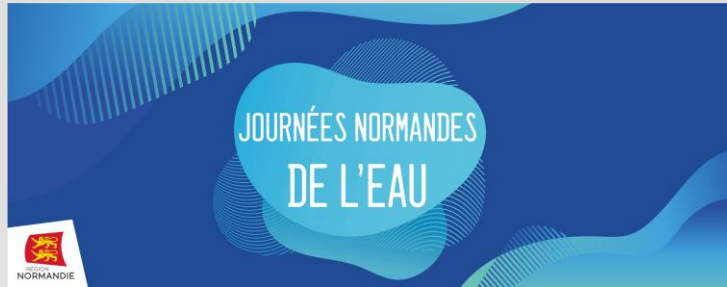
Les journées normandes de l'eau